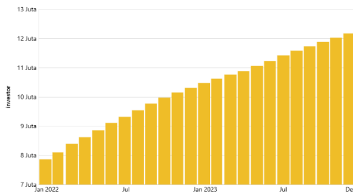
Gambar 1. Grafik Jumlah Investor Pasar Modal Indonesia (Januari 2022-Desember 2023)

Jumlah investor pasar modal mencapai 12,16 juta orang pada Desember 2023, naik 140.375 orang atau 1,17% dari bulan sebelumnya (bulan ke bulan/mtm), menurut data Kustodian Sentral Efek Indonesia (KSEI). Jumlah investor pasar modal Indonesia meningkat 18,01% tahunan/tahunan pada Desember 2023 dibandingkan dengan Desember 2022. Seperti yang ditunjukkan pada grafik pada gambar 1, jumlah investor pasar modal Indonesia terus meningkat dalam dua tahun terakhir. Sehingga Desember 2023, hanya 0,34% institusi dan 99,66% investor adalah individu. Investor pasar modal Indonesia didominasi oleh laki-laki, dengan 62,33% dari total aset senilai 1.150,28 triliun; sisanya, 37,67% dari total aset senilai 240,22 triliun, adalah perempuan. Lebih dari separuh investor pasar modal Indonesia berusia di bawah 30 tahun, atau 56,43%, memiliki aset sebesar Rp35,09 triliun. Investor berusia 31 hingga 40 tahun memiliki 23,58% aset sebesar Rp92,12 triliun, dan investor berusia 41 hingga 50 tahun memiliki 11,55% aset sebesar Rp148,87 triliun. Meskipun proporsinya kecil, kelompok usia 51 hingga 60 tahun memiliki proporsi 5,53%, dan kelompok usia 60 tahun ke atas 2,91%.