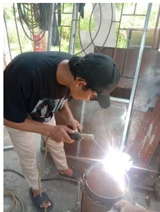
Gambar 4. Pengelasan Tutup dan Tabung Kondensor

Kemudian, dilakukan pengelasan pada tutup tabung kondensor, yang terlihat pada Gambar 4.