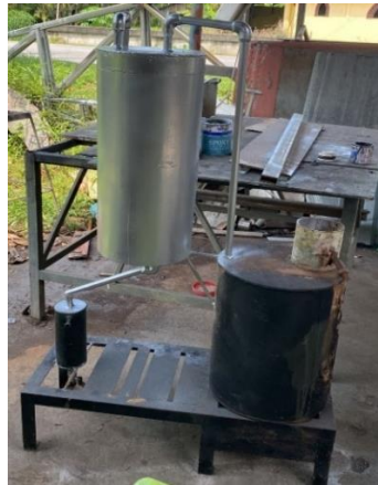
Gambar 6. Hasil Rakitan

Akhirnya, hasil dari rakitan alat yang telah didesain ditampilkan pada gambar dibawah ini.