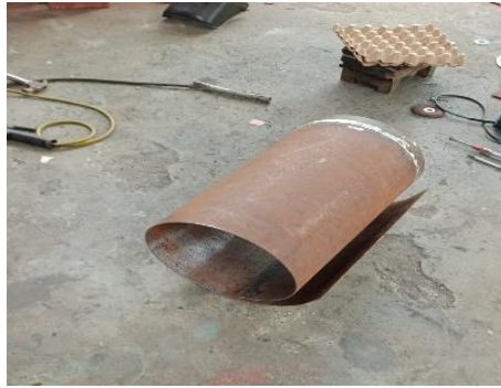
Gambar 2. Tabung Kondensor

Setelah itu, dilakukan pembuatan tutup atas dan bawah tabung kondensor. Proses berikutnya adalah penyambungan atau pemasangan tabung kondensor dan tutupnya menggunakan tali, sebagaimana ditunjukkan pada Gambar 3.