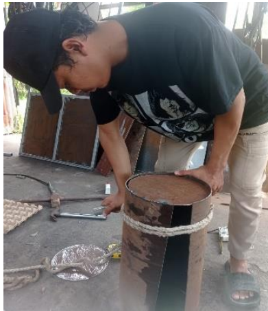
Gambar 3. Pembuatan Tabung Kondensor

Setelah itu, dilakukan pembuatan tutup atas dan bawah tabung kondensor. Proses berikutnya adalah penyambungan atau pemasangan tabung kondensor dan tutupnya menggunakan tali, sebagaimana ditunjukkan pada Gambar 3.