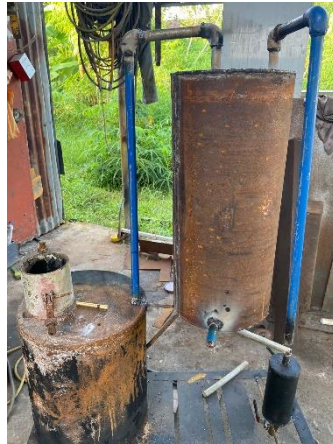
Gambar 5. Penataan Pipa Kondensor

keluar dipasang pada kondensor. Langkah selanjutnya adalah penataan pipa minyak dan air pada sistem pirolisis, sebagaimana terlihat pada Gambar 5 berikut ini.