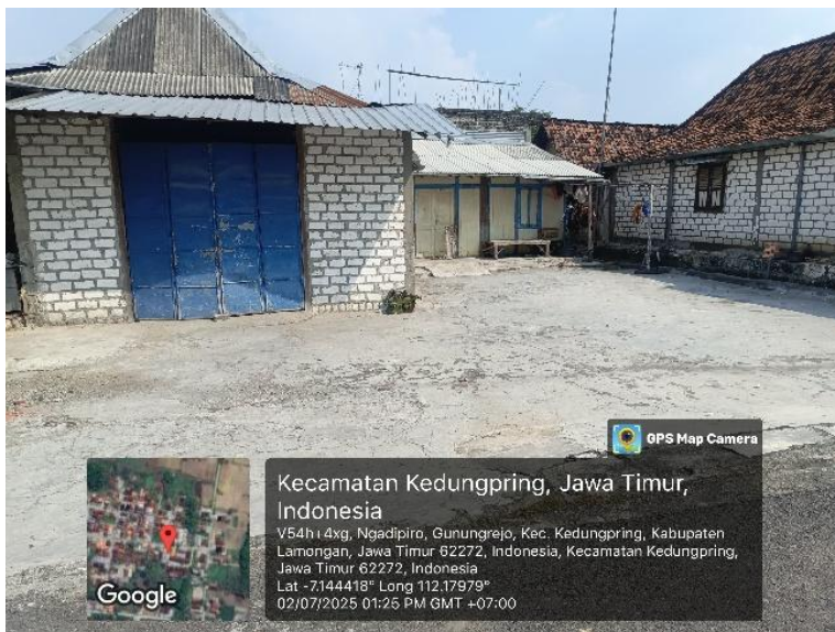
Gambar 3. Gudang Penggilingan Padi Desa Gunungrejo

Sebagai upaya untuk mendukung distribusi dan ketersediaan pangan lokal, kelompok tani bekerja sama dengan seleb, yaitu gudang penggilingan padi lokal. Melalui kerja sama ini, padi hasil panen dapat langsung diproses menjadi beras dan disimpan untuk kebutuhan pangan desa. Gudang Penggilingan Padi juga berperan dalam menampung hasil panen petani agar tidak menumpuk di rumah tangga petani dan tetap memiliki nilai jual (Branch et al., 2025). Kehadiran unit penggilingan padi di tingkat desa bukan sekadar penyediaan sarana mekanisasi pertanian, melainkan manifestasi dari upaya membangun instrumen stabilitas sosio-ekonomi di pedesaan. Sebagai infrastruktur strategis, penggilingan ini berfungsi sebagai jembatan yang menghubungkan ruang produksi petani dengan kepastian pasar, sekaligus bertindak sebagai benteng pertahanan terhadap volatilitas eksternal. Dengan adanya sistem integrasi ini, desa mampu mengartikulasikan kemandiriannya melalui pengelolaan cadangan beras mandiri—sebuah langkah protektif yang vital dalam memitigasi risiko masa paceklik maupun guncangan harga di pasar global yang sering kali merugikan produsen skala kecil.