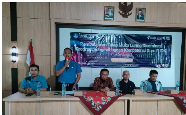
Gambar 1. Pembukaan PPKG PJOK Kab. Jepara

Program Pengembangan Kompetensi Guru Pendidikan Jasmani Olahraga Kesehatan (PPKG PJOK) merupakan salah satu upaya untuk pemenuhan kebutuhan kompetensi guru merujuk standar kompetensi teknis sebagaimana Peraturan Direktur Jenderal Guru dan Tenaga Kependidikan Nomor 2626/B/HK.04.01/2023 tentang Model Kompetensi Guru dan rencana pengembangan karier (Ambarrukmi et al., n.d.). Program ini juga sebagai tindak lanjut Kemendikbudristek merespon Peraturan Presiden No. 86 Tahun 2021 tentang Desain Besar Olahraga Nasional yang ditujukan bagi guru mata pelajaran PJOK, melalui pelatihan dan kegiatan kolektif guru.