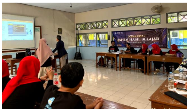
Gambar 4. Pelaksanaan Lokakarya 7 Angkatan 10

Program Pendidikan Guru Penggerak angkatan 10 ini dimulai pada tanggal 15 Maret 2024 dengan daerah sasaran di Provinsi Jawa Tengah sebanyak 21 kabupaten/kota, sedangkan Lokakarya 7 PGP Angkatan 10 ini dilaksanakan pada tanggal 26-27 dan atau 27-28 Oktober 2024 di 21 kabupaten/kota tersebar, yang diikuti oleh pengajar praktik dan calon guru penggerak (CGP). Program ini bertujuan untuk memberikan bekal kemampuan kepemimpinan pembelajaran dan pedagogik kepada guru sehingga mampu menggerakkan komunitas belajar, baik di dalam maupun di luar satuan pendidikan serta berpotensi menjadi pemimpin pendidikan yang dapat mewujudkan rasa nyaman dan kebahagiaan peserta didik ketika