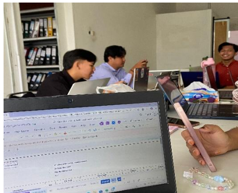
Gambar 2. Pemanfaatan Aplikasi ATLAS dalam Mendukung Proses Audit

aplikasi tersebut, kemudian diarahkan untuk mencoba langsung mengoperasikan sistem dalam mengolah data audit. Mahasiswa mulai dari memasukkan data laporan keuangan klien, mengidentifikasi akun-akun yang akan diuji, hingga menyusun kertas kerja audit secara bertahap di dalam sistem. Proses ini memberikan gambaran nyata bahwa audit tidak hanya dilakukan secara manual, tetapi juga memanfaatkan teknologi untuk meningkatkan ketelitian dan efisiensi kerja. Melalui penggunaan ATLAS, mahasiswa dapat memahami keterkaitan antara data keuangan, prosedur audit, serta hasil pemeriksaan dalam satu alur yang terintegrasi. Hal ini sejalan dengan Rahmatika et al. (2025) yang menyatakan bahwa pemanfaatan teknologi dalam kegiatan magang membantu mahasiswa memahami proses audit secara lebih sistematis dan terstruktur.