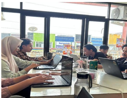
Gambar 1. Pengumpulan dan Pemeriksaan Bukti Audit

Selama pelaksanaan magang, salah satu tugas yang dilakukan mahasiswa adalah menangani kelengkapan dokumen audit yang diperlukan dalam proses pemeriksaan. Kegiatan ini mencakup pengumpulan berbagai dokumen penting, seperti bukti transaksi dan data keuangan lainnya, yang kemudian diperiksa kesesuaiannya dengan catatan yang ada. Mahasiswa tidak hanya berperan sebagai pengumpul data, tetapi juga melakukan pengecekan terhadap keakuratan dan kelengkapan dokumen tersebut. Hal ini penting karena dokumen yang telah diverifikasi akan menjadi dasar dalam proses audit selanjutnya. Aktivitas ini secara tidak langsung melatih ketelitian serta kemampuan mahasiswa dalam memahami alur audit secara lebih mendalam. Melalui keterlibatan dalam pengelolaan dokumen audit dapat membantu mahasiswa meningkatkan pemahaman terhadap pentingnya bukti audit serta mengasah kemampuan analisis dalam proses pemeriksaan.