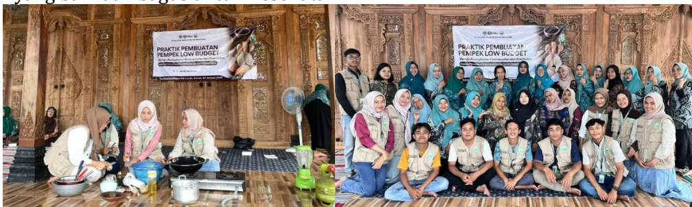
Gambar 2. Pelaksanaan Praktik Pembuatan Pempek Low Budget bersama ibu-ibu PKK

Pada tanggal 30 Januari 2026, tim pengabdian bersama ibu-ibu PKK melaksanakan praktik pembuatan pempek versi low budget di kediaman Ibu Kades Trirejo sekaligus Pembina PKK. Para anggota PKK Desa Trirejo sangat antusias dengan adanya pembelajaran dan pelatihan baru tentang usaha pembuatan pempek versi low budget dengan bahan olahan dasar menggunakan udang rebon. Udang rebon merupakan bahan baku yang mudah didapat, murah, serta mempunyai nilai jual yang tinggi jika sudah menghasilkan suatu produk yang mempunyai nilai gizi yang baik dan bagus untuk Kesehatan.