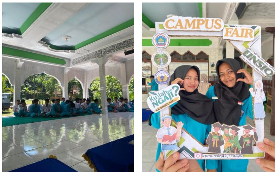
Gambar 4 . Kampus Fair UNSIQ