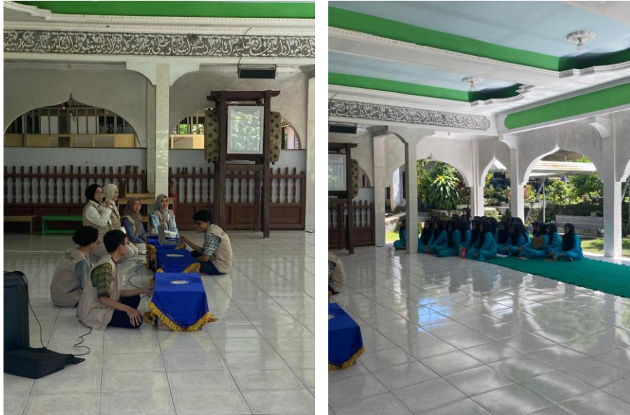
Gambar 3. Penjelasan Materi Peran Pendidikan Tinggi Bagi Siswa Di MA Riadlul Muta'allimin