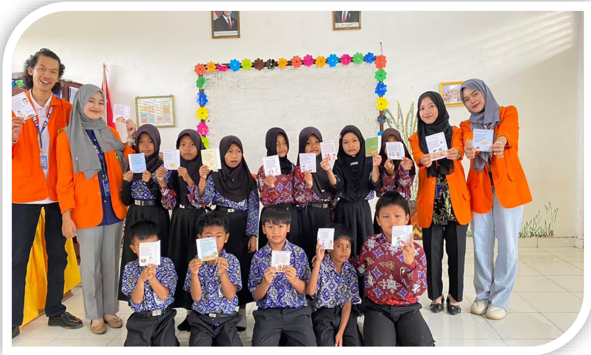
Gambar 5 Mahasiswa Unbara Bersama siswa sdn 37 oku