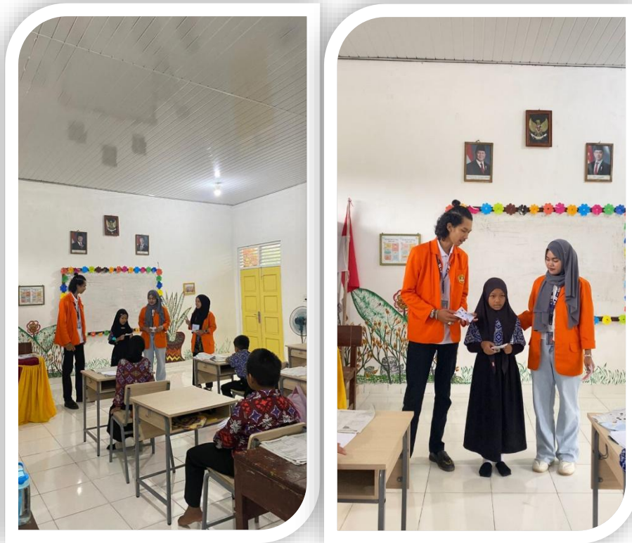
Gambar 3 Dokumentasi Pembelajaran Numerisasi