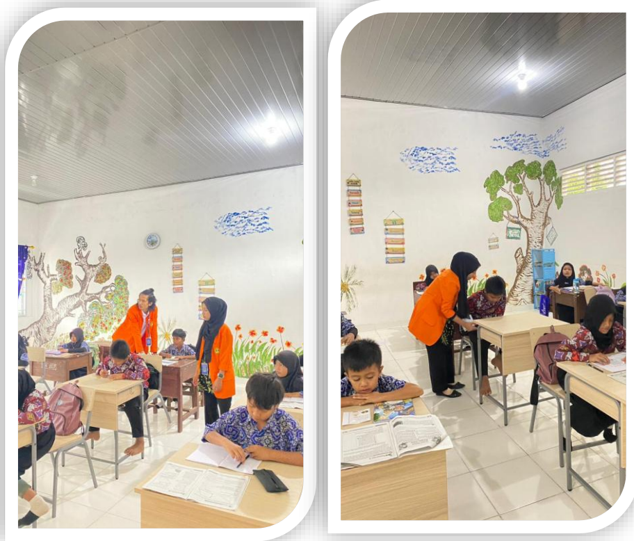
Gambar 2 Dokumentasi Pembelajaran Literasi

upaya yang dapat dilakukan untuk memperkuat literasi dan numerasi untuk mendukung merdeka belajar. Strategi dimulai dari membangun budaya literasi di setiap satuan pendidikan.