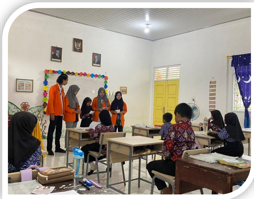
Gambar 4 Dokumentasi Pembelajaran pada siswa sdn 37 oku