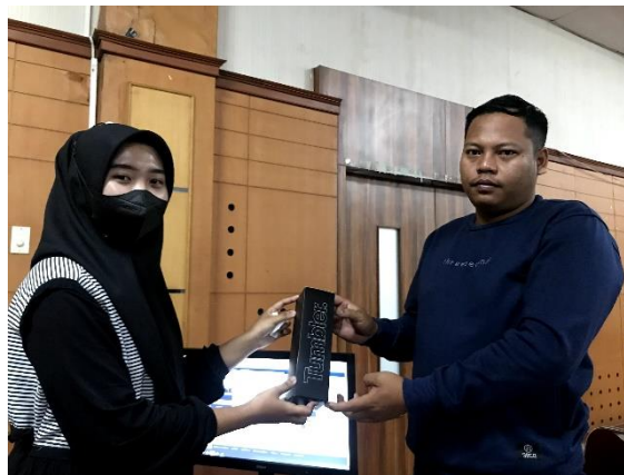
Gambar 4. Penyerahan reward kepada WPOP