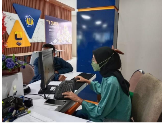
Gambar 3. Pendampingan pelaporan SPT