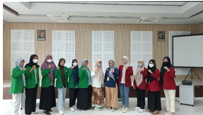
Gambar 2. Pelatihan dan pembekalan relawan pajak