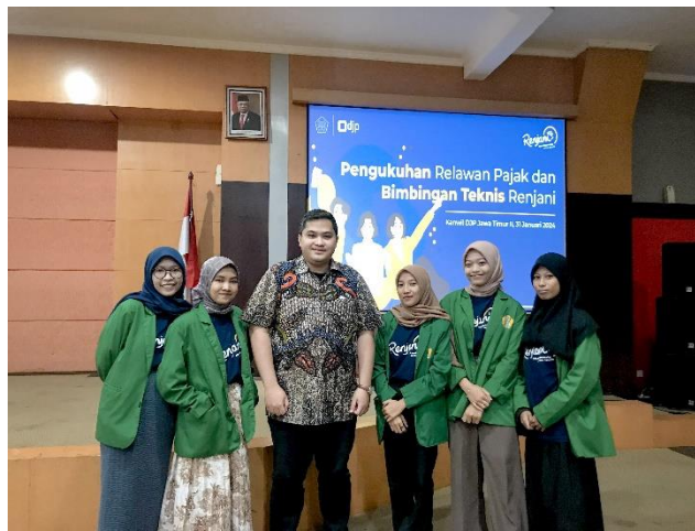
Gambar 3. Penguatan dan Bimbingan Teknik Relawan Pajak

Setiap kendala yang dihadapi oleh relawan pajak tentunya memiliki solusi untuk mengatasinya. Ketika terjadi kendala teknis, relawan dapat melaporkannya kepada karyawan yang bertugas, yang kemudian akan mengkomunikasikannya dengan pihak ICT kantor. Sebagai alternatif, wajib pajak juga dapat menggunakan ponsel pribadi untuk melaporkan SPT. Jika wajib pajak tidak membawa bukti potong, mereka disarankan mencarinya terlebih dahulu, atau jika tidak memilikinya, dapat menghitung penghasilan secara mandiri dengan bantuan karyawan yang bertugas. Untuk mereka yang tidak mengetahui nomor EFIN, akan diarahkan kepada petugas khusus EFIN. Relawan pajak juga membantu wajib pajak yang belum mendaftarkan akun DJP Online dari awal hingga proses selesai, serta membantu mengatur ulang kata sandi bagi yang lupa. Bagi wajib pajak yang kurang memahami penggunaan e-Filing, relawan memberikan penjelasan secara perlahan dan mendetail. Jika masih ada kesulitan, karyawan yang bertugas akan turut membantu untuk memastikan wajib pajak memahami proses pelaporan SPT dengan benar.