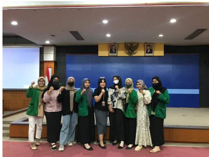
Gambar 4. Pembekalan Relawan Pajak oleh KPP Pratama Sidoarjo Barat