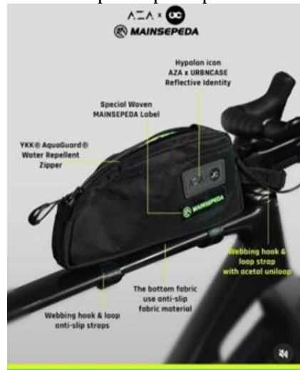
Gambar 2 sesi pemotretan pada product mainsepeda x aza

c). Penulis diberi tanggung jawab untuk mempersiapkan peluncuran produk baru, yang mencakup berbagai tahapan, mulai dari mempersiapkan product hingga mengikuti sesi pemotretan produk.