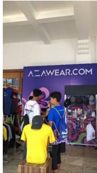
Gambar 1 membuat konten di booth event smadafiestarun

b). Penulis bertanggung jawab untuk membuat caption untuk postingan feeds dan instastory di media sosial seperti Tiktok dan Instagram.