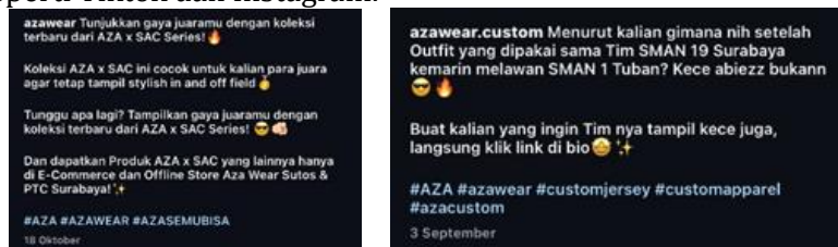
Gambar 3 membuat caption postingan feeds instagram

b). Penulis bertanggung jawab untuk membuat caption untuk postingan feeds dan instastory di media sosial seperti Tiktok dan Instagram.