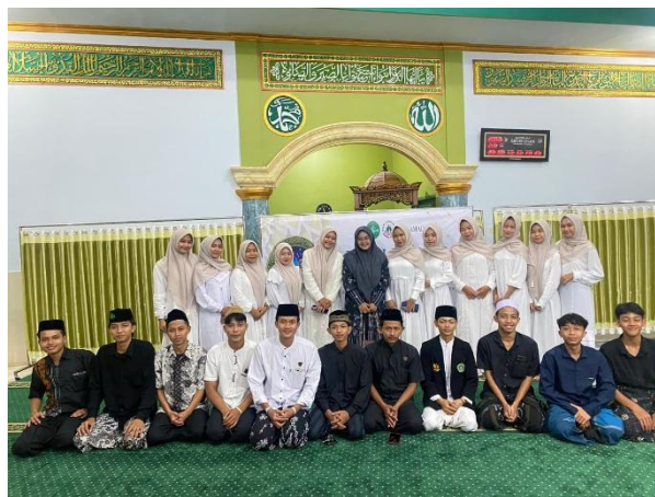
Gambar 1. Muraqabah→Kesadaran Ilahi→Inner Control→Resiliensi Siber

Solusi Spiritual-Methodologis (Muraqabah): Aspek spiritual menjadi jalan keluar atas ketidakmampuanfisikorangtuamemantaugawaianaksecaraterus-menerus. Solusiyang ditekankan adalah penanaman konsep spiritualitas Muraqabah (kesadaran penuh bahwa setiap gerak-gerik senantiasa diawasi oleh Allah SWT).